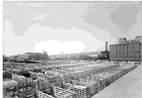
Canada Packers stock yards, south-west corner of Keele Street and St.Clair Avenue West.