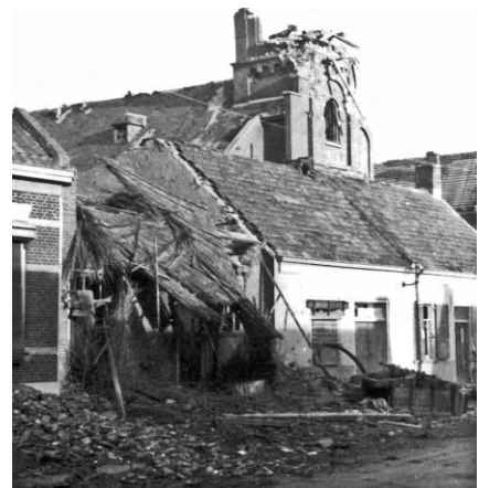
Kerk van Woensdrecht