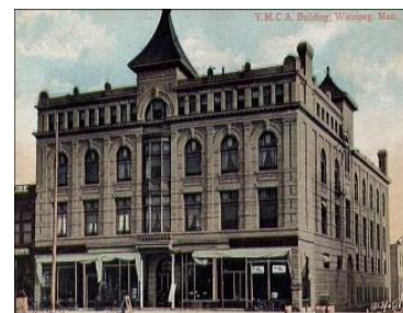
YMCA gebouw Winnipeg, Manitoba