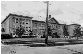
Norquay Elementary School 1926