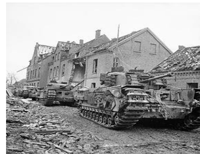
Churchill tanks rijden in een vernielde straat in Kleve - Duitsland

Alle doelen van het bataljon worden behaald en er worden maatregelen genomen tegen eventuele tegenaanvallen. Tegen de middag van de 26e rond de 6e Brigade zijn taak van de eerste fase operatie "Blockbuster" met succes af. Dit is goed voor het moraal.